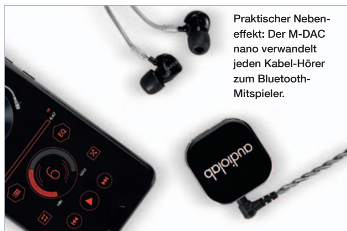
Praktischer Nebeneffekt: Der M-DAC nano verwandelt jeden Kabel-Hörer zum Bluetooth-Mitspieler.

nach wie vor von der Qualität des Ursprungssignals abhängig – hier wird gerechnet, nicht dazufantasiert. Aber der nano konnte überzeugen. Klar legte die Feinauflösung der Mitten zu. Auch zu harschen Höhen wurde die Schärfe genommen. Die Tiefen erhielten vor allem im Oberbass mehr Kontur. Und: Der nano macht aus jedem kabelgebundenen Wandler einen Bluetooth-Kopfhörer – Quelle und Lauscher können getrennt betrieben werden. Zieht man noch den Preis hinzu, so darf man klar von einer sinnvollen Option sprechen – süß, super, Kaufempfehlung. Andreas Günther ■