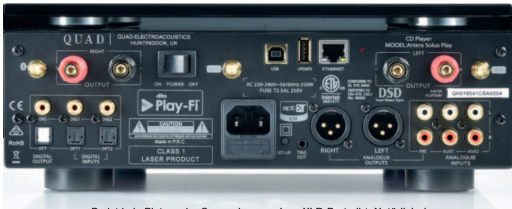
Da ist kein Platz mehr: Super, dass es einen XLR-Port gibt. Natürlich dazu ein Aufgebot an Digital-Zugängen – inklusive Ethernet und USB.