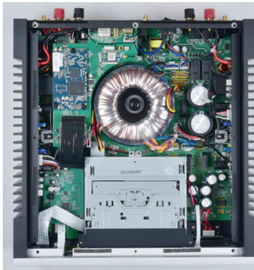
Das Machtwort im Zentrum: Ein großer Ringkerntrafo verstrickt die Stromkraft. An der Front liegt das dünne Einzugslaufwerk für CDs. Die Seitenwangen dienen als Kühlrippen für Class-A/B.