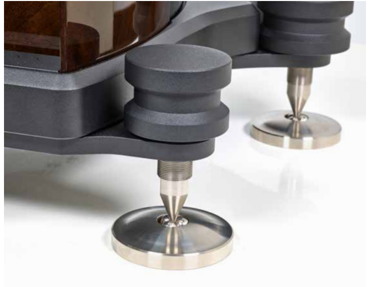
Details der wuchtigen Aluminium-Bodenplatte. Spikes und Bodenschoner bestehen ebenfalls aus Leichtmetall. Genial konstruiert: Die drei Kugeln zentrieren die Metallscheiben nach dem Aufstellen von selbst und lassen den Lautsprecher minimal gelöst spielen.

Einzelteilen und einem experimentellen Tonarm bewundern konnten. Eigentlich logisch und konsequent, denn auch bei der Verwendung innovativer Materialien – allem voran Carbon – war Wilson Benesch immer Vorreiter.