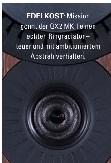
EDELKOST: Mission gönnt der QX2 MKII einen echten Ringradiator – teuer und mit ambitioniertem Abstrahlverhalten.

Hören wir hinein. Mozart, die Klavierkonzerte. Vladimir Ashkenazy dirigiert und spielt die Nummer 20. Der langsame Satz wurde Mozart von den Engeln in die Feder diktiert. Ein feines Beben. Hier braucht es Samt und dennoch Zugriff. So haben wir die Mission an einen kleinen Röhrenverstärker angeschlossen, mehr braucht es nicht. Dann das Solo des Klaviers. Fast ein Selbstgespräch, bis die Streicher einsetzen. Ei-