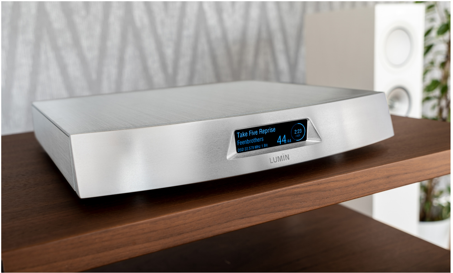
Edle Erscheinung: Der Lumin T2 kommt frontal komplett ohne Bedienelemente aus.