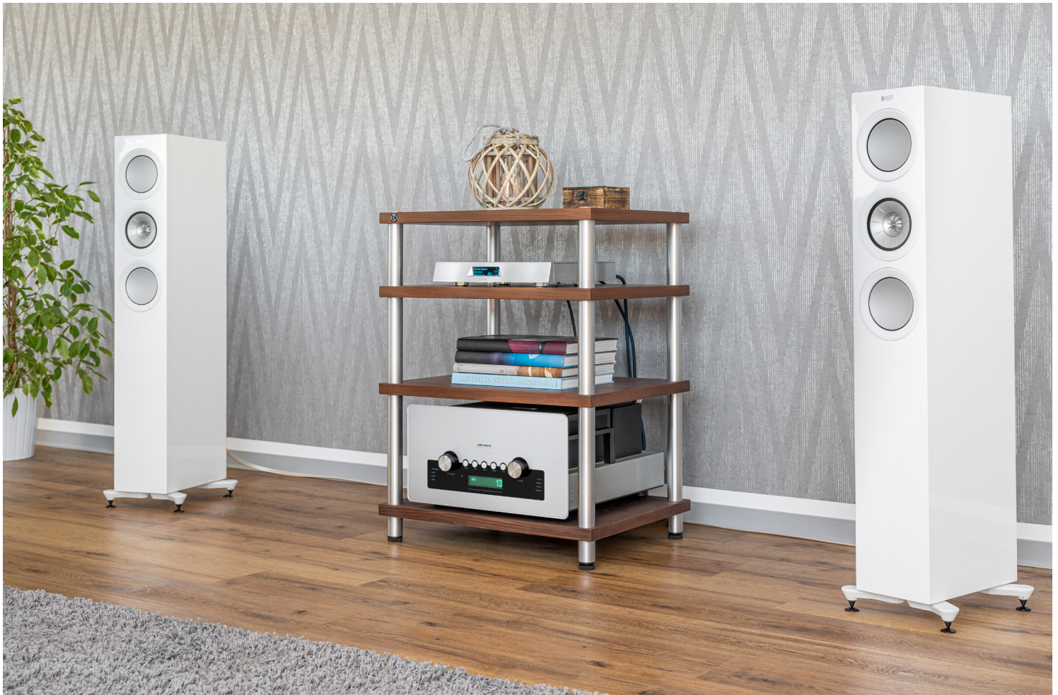
Der schicke Netzwerkplayer passt besonders zu einem modernen Ambiente.